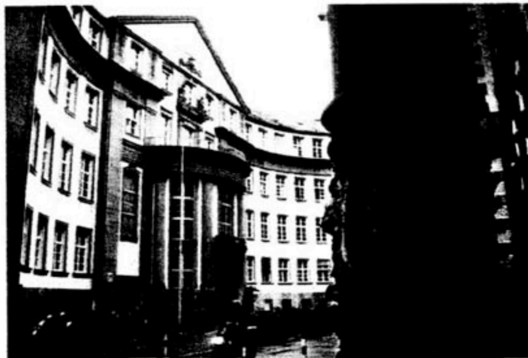
Frankfurter Landgericht: Deutliche Warnung

Das Jugendamt gab unter dem Druck klein bei. Eigentlich hätte es beide Mädchen vorläufig in Obhut nehmen können. Aber die Mitarbeiter fürchteten, beim Familiengericht an der Anwältin der Gegenseite zu scheitern – und intervenierten dann nicht.